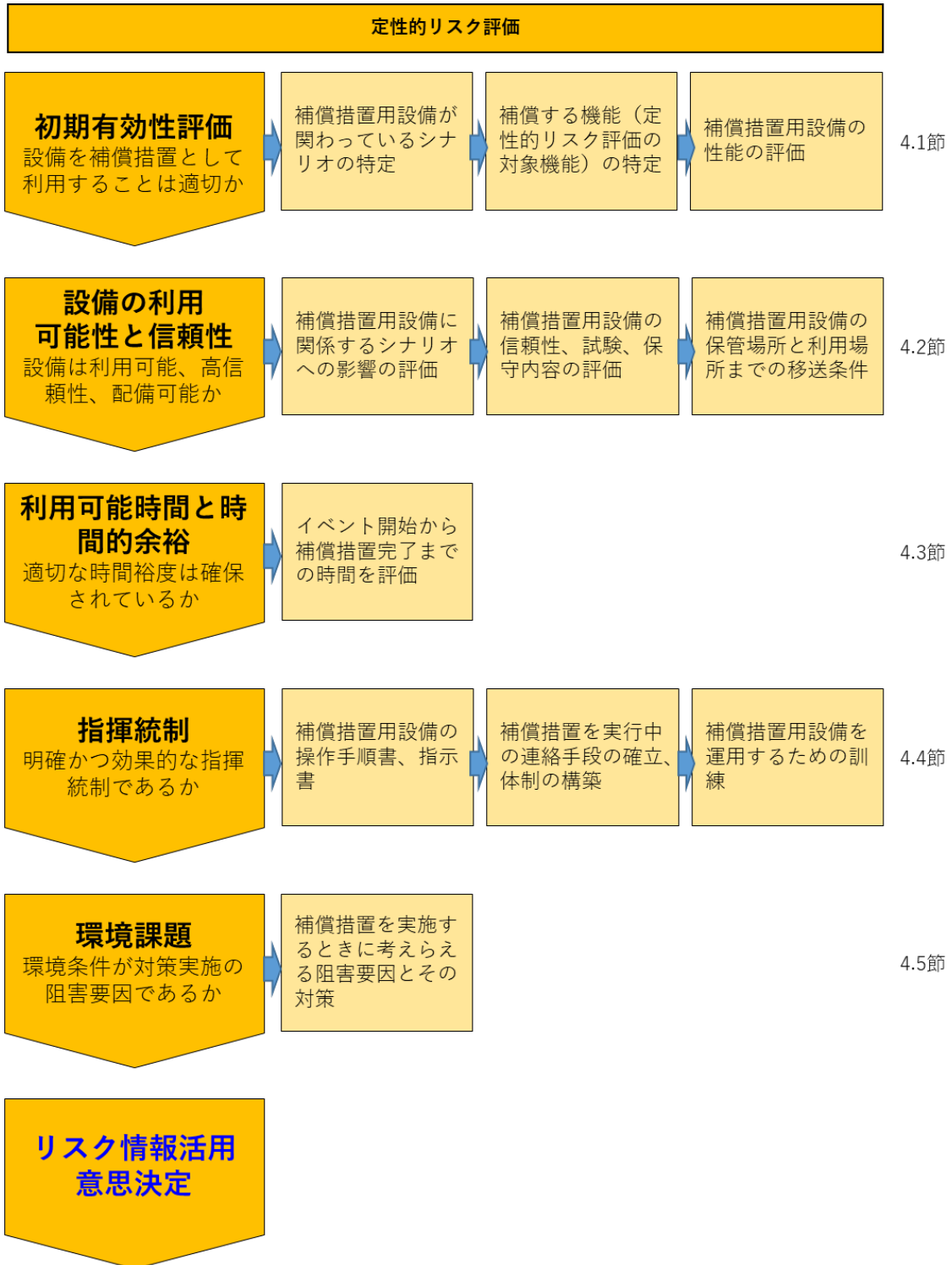
図 1：SA 設備の OLM 実施時の定性的リスク評価における検討事項