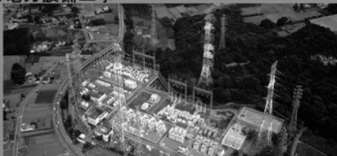
変電・水力発電設備に関する施工計画・施工管理、調査設計